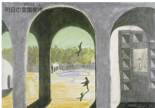
《明日のネクロポリス》(2012)